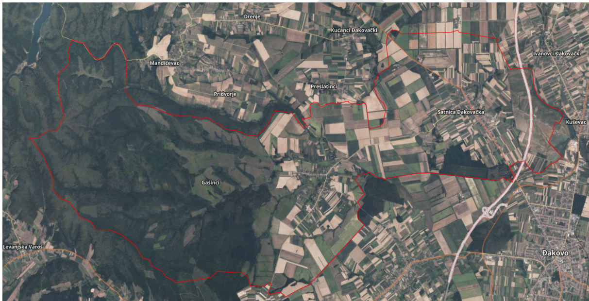
Karta Općine Satnica Đakovačka

Naselja koja spadaju pod Općinu Satnica Đakovačka su: Gašinci i Satnica Đakovačka.